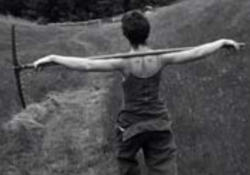
Progetto grafico Neodesign - Verona Stampa La Grafica - Vago (VR)